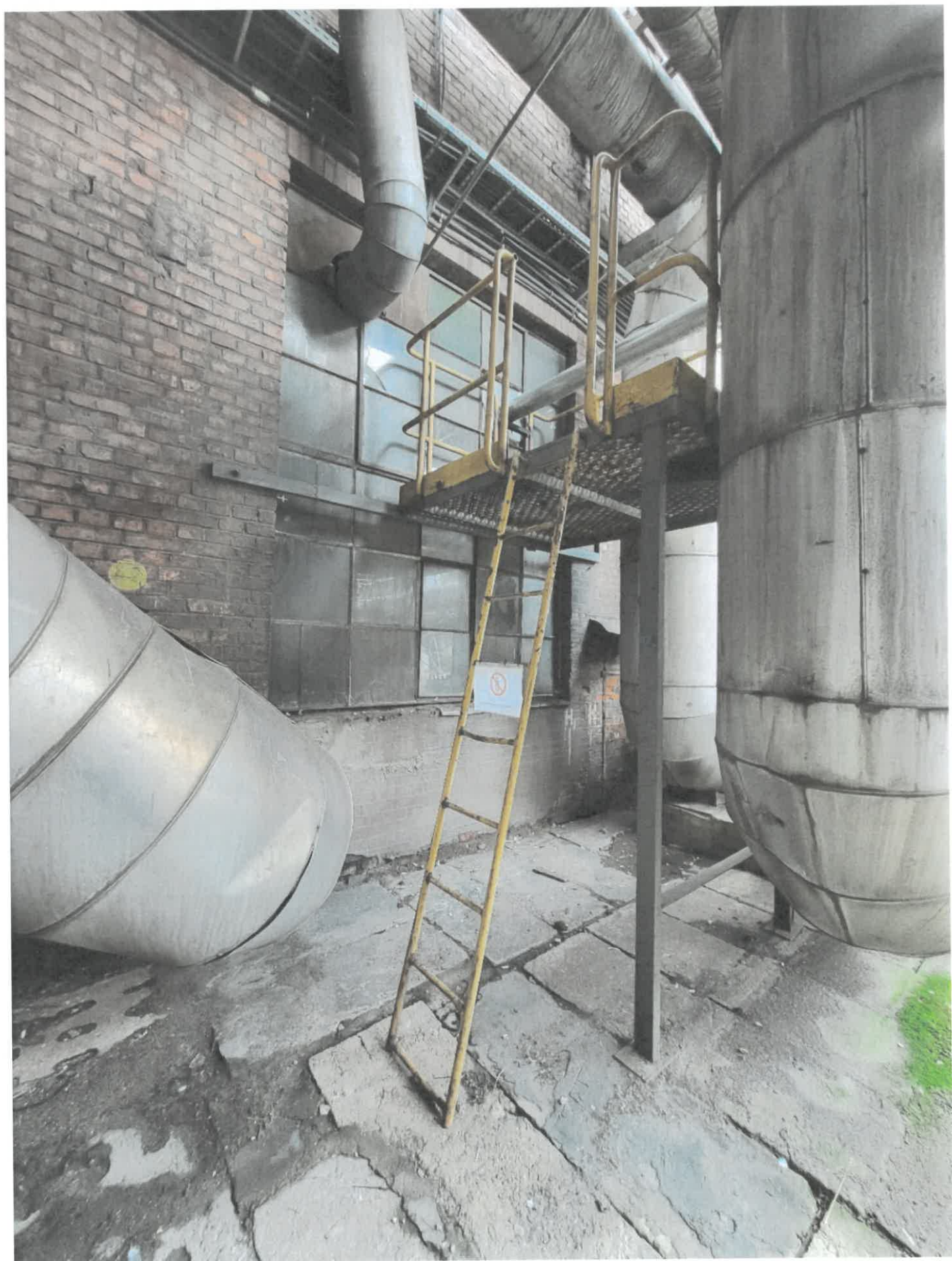
Podest nr 2