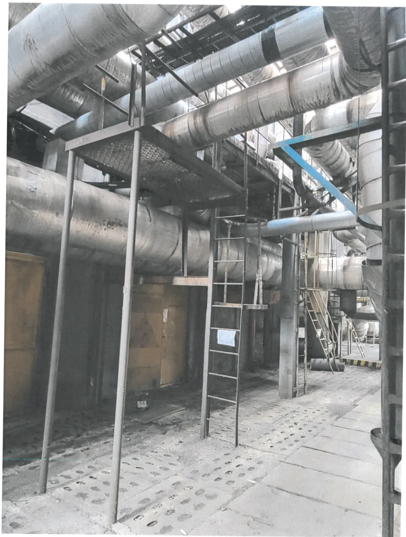
Podest nr 6 – ujęcie od strony południowej