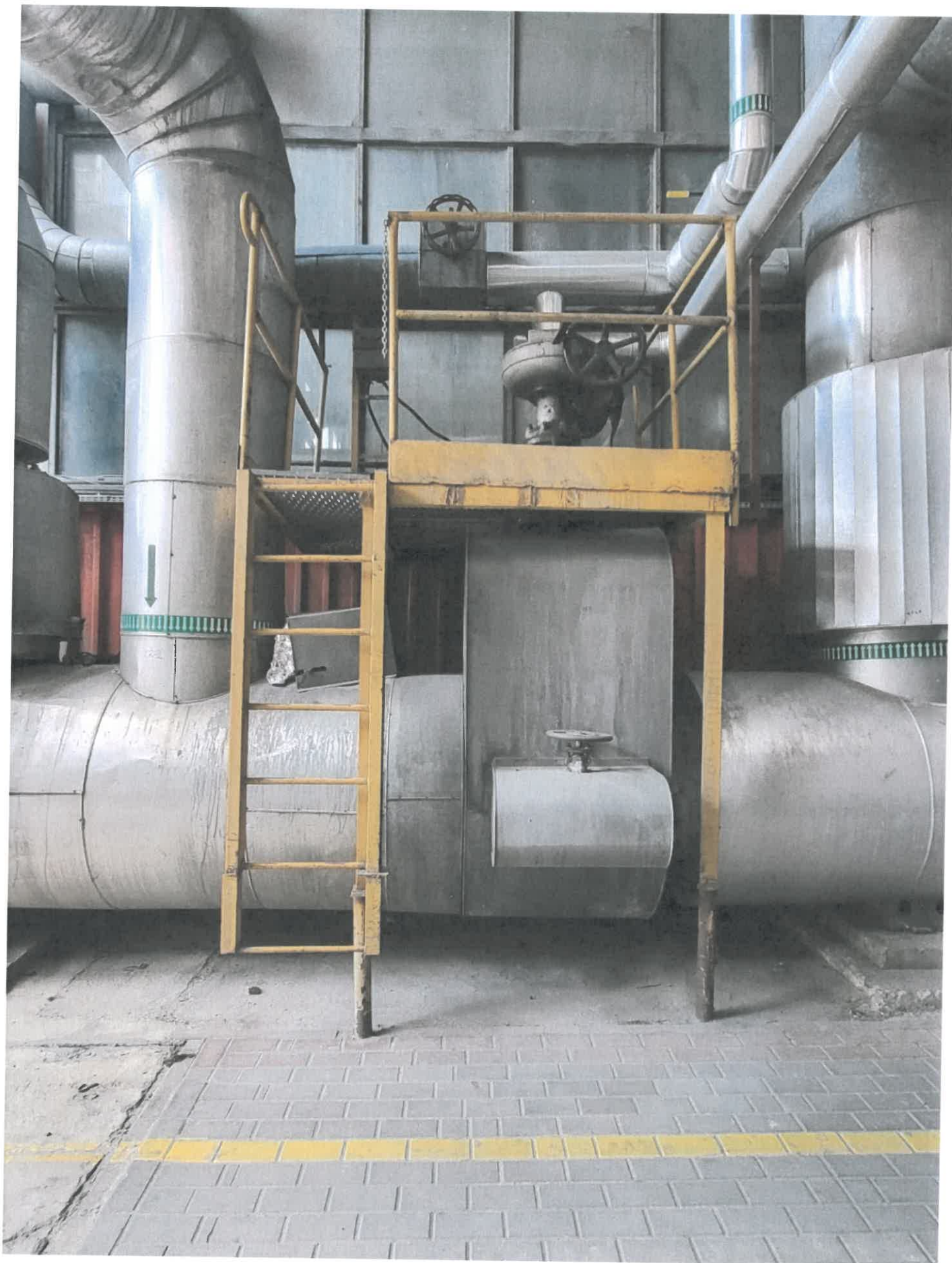
Podest nr 3