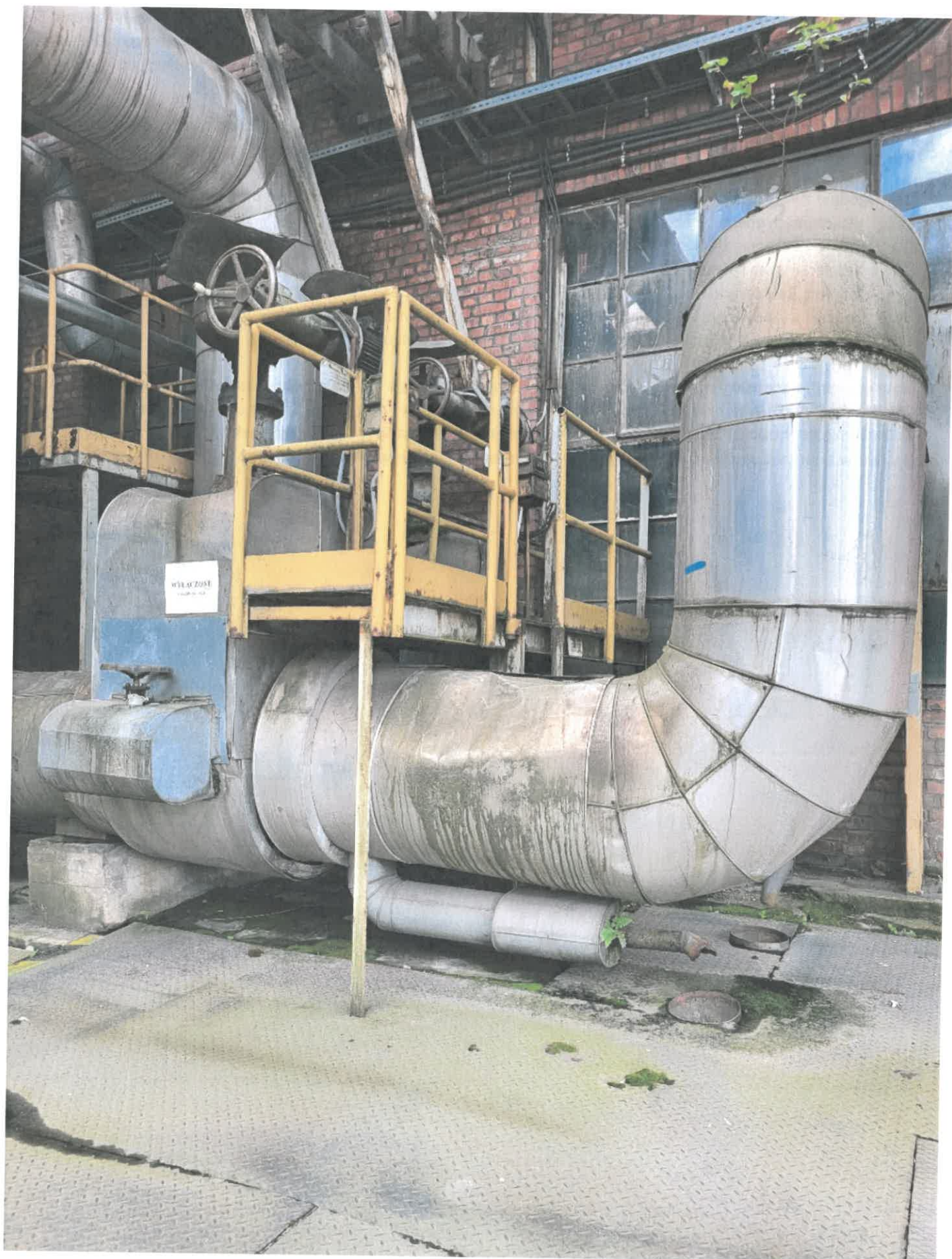
Podest nr 1