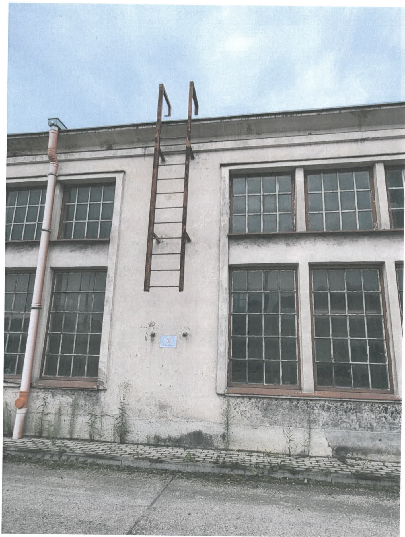
Budynek pompowni wody chłodzącej – nowy, drabina zewnętrzna nr 1 – (demontaż i montaż nowej).