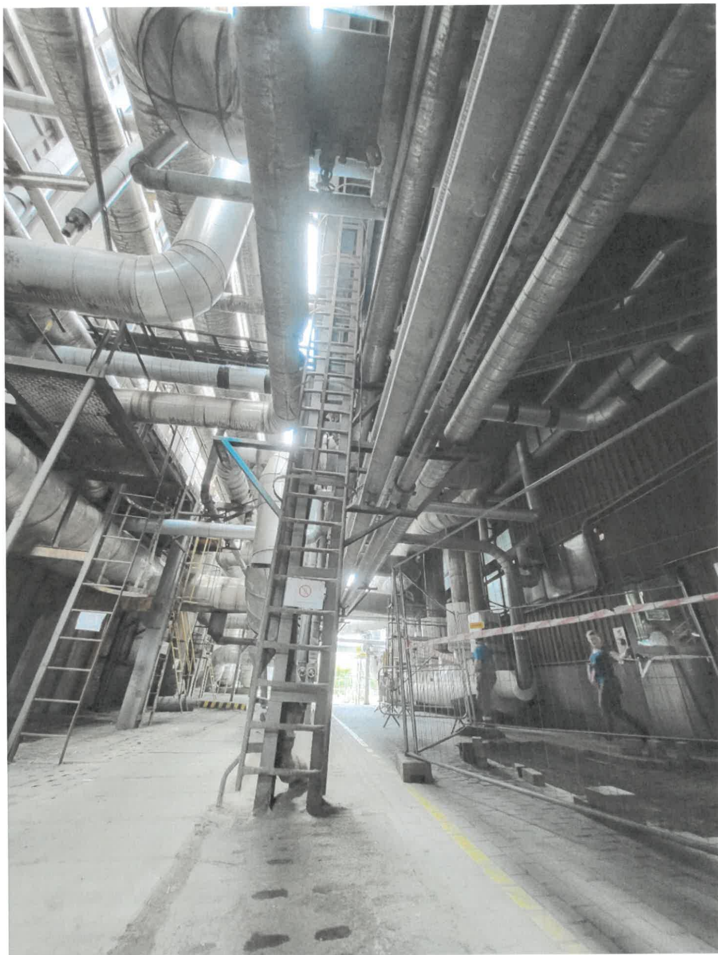
Drabina nr 1