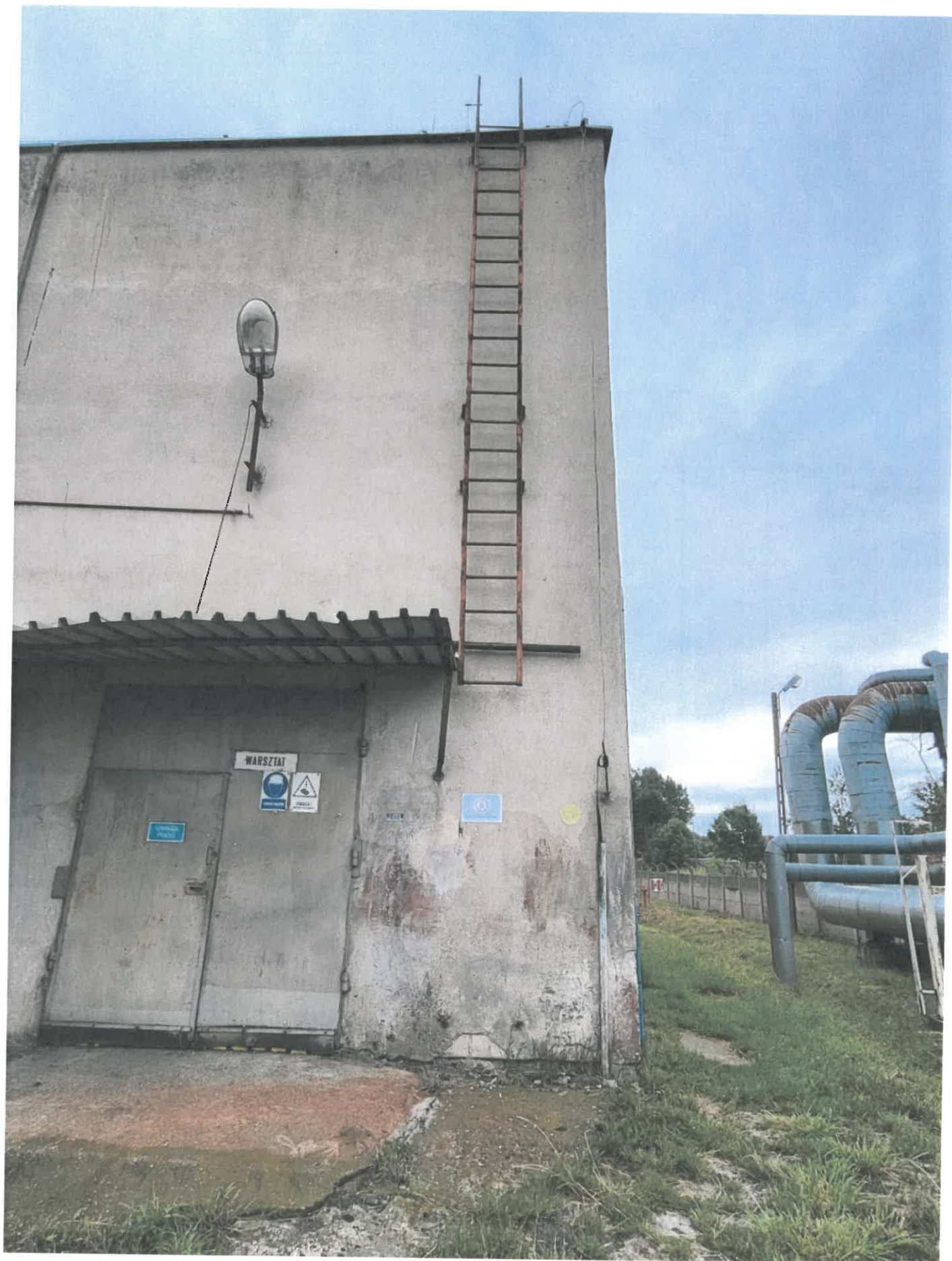
Budynek garażowo - socjalny, drabina zewnętrzna nr 3 – (demontaż i montaż nowej).