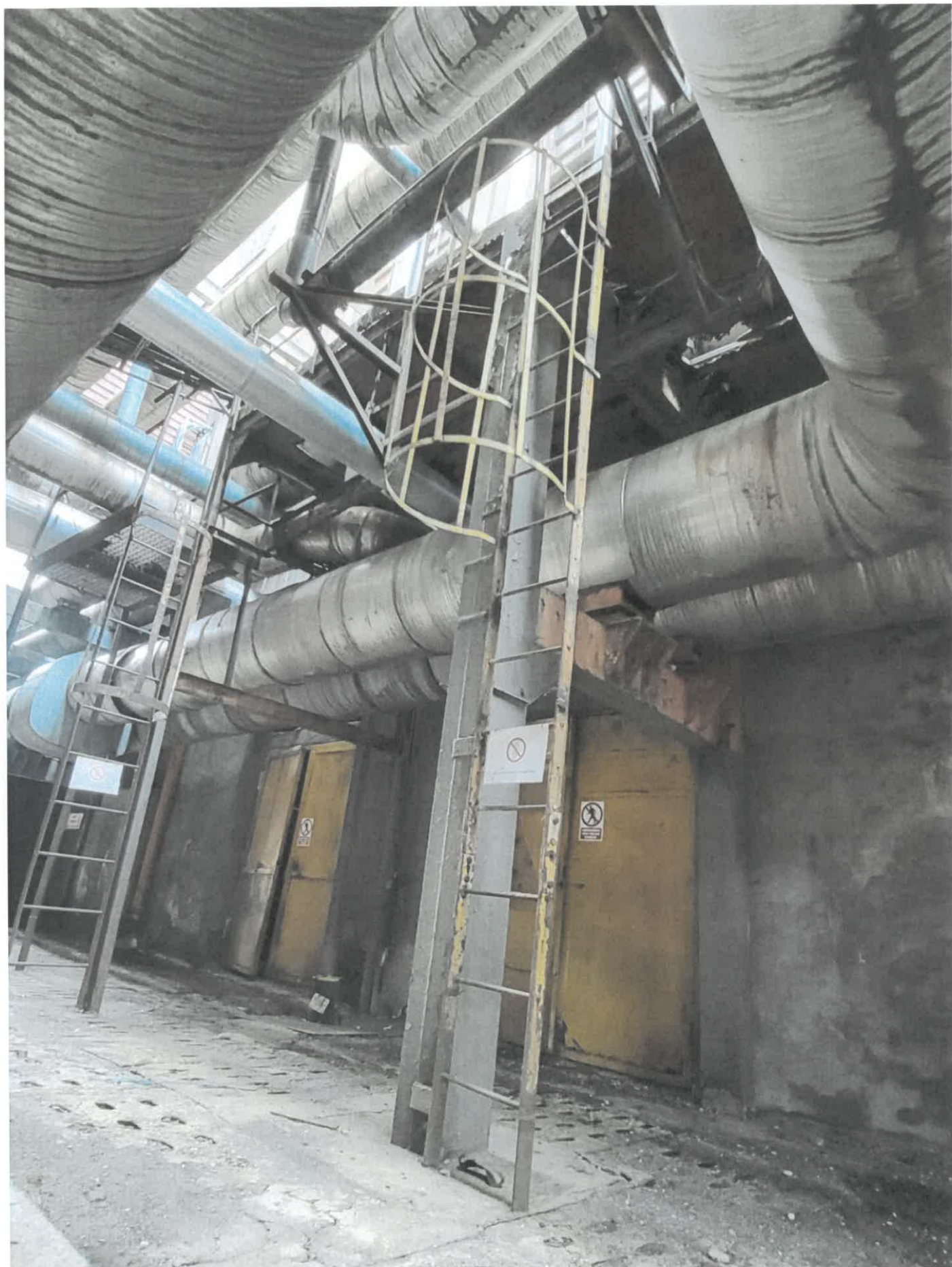
Podest nr 6 – ujęcie od strony północnej