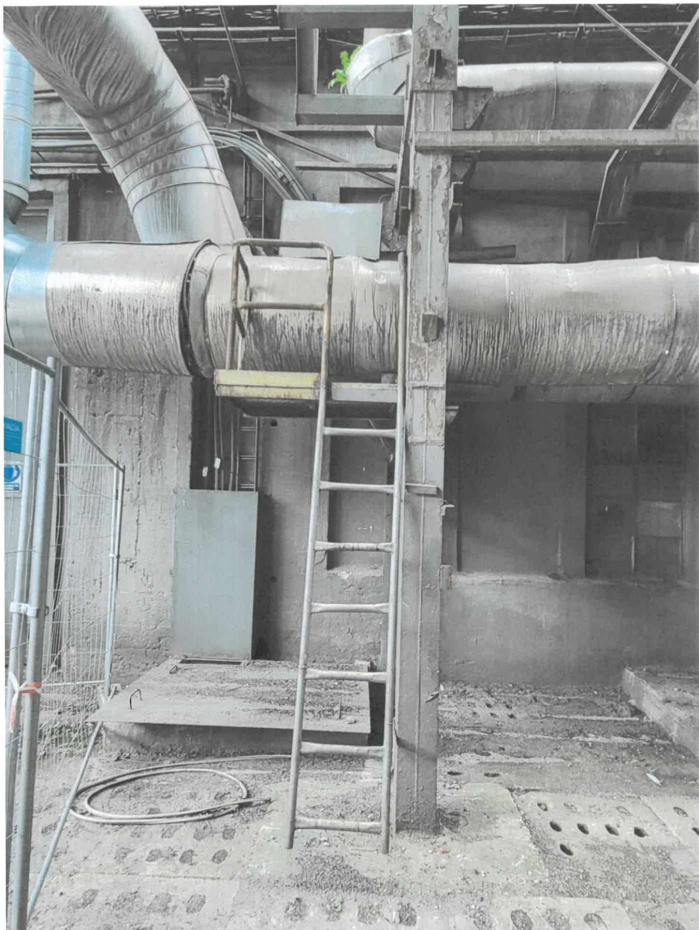
Podest nr 7