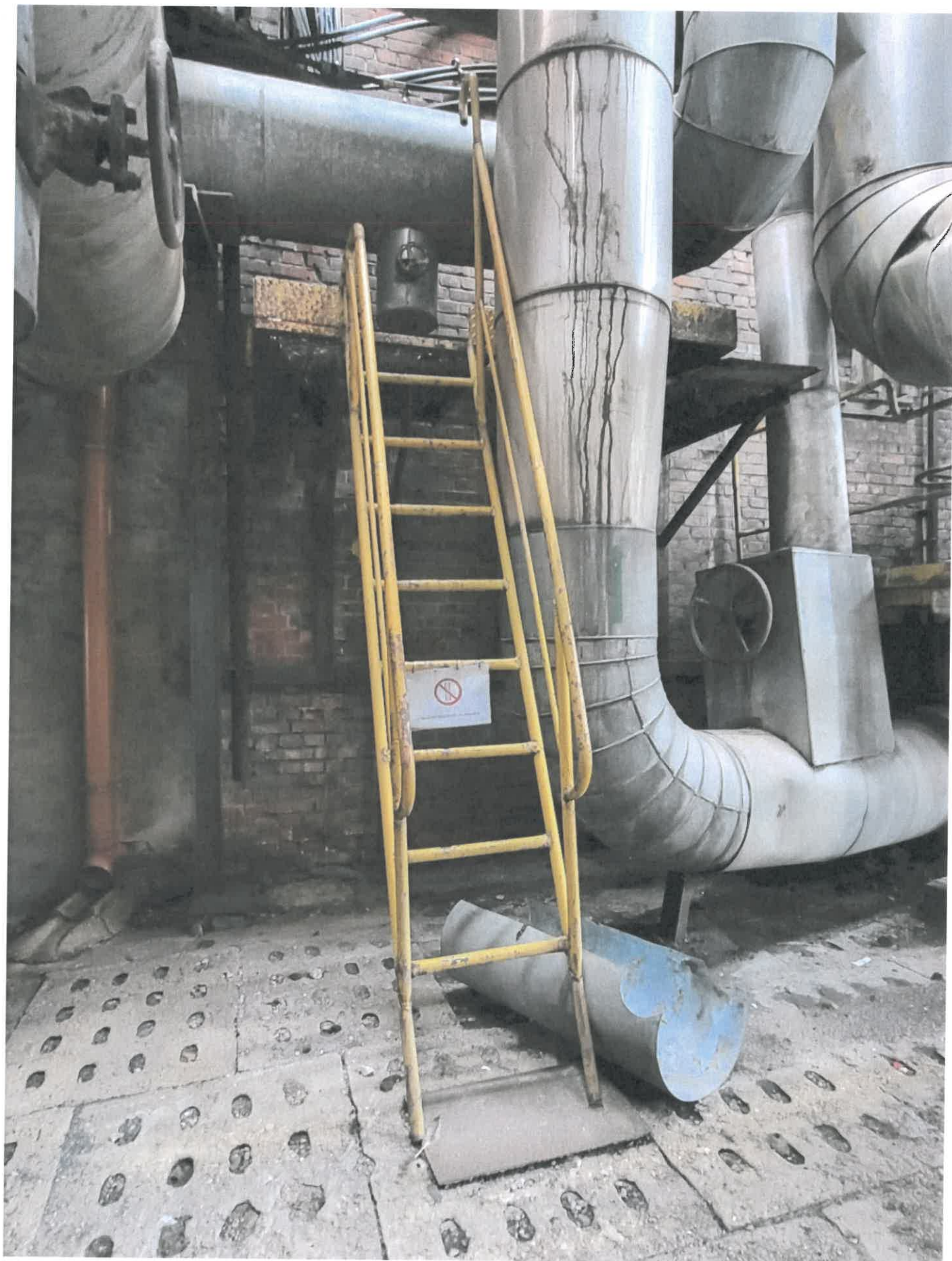
Podest nr 5