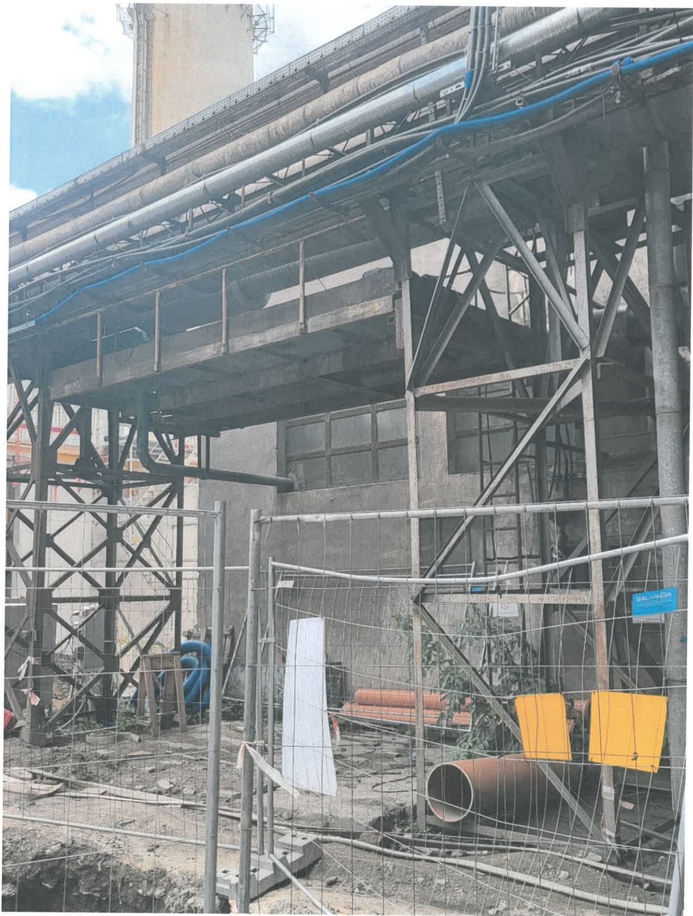
Podest nr 8